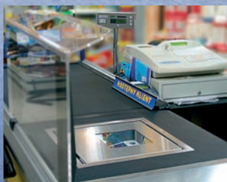
Waga wbudowana w blat stanowiska kasowego