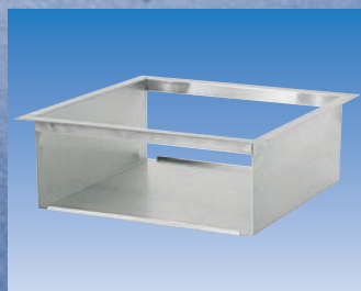
Opcjonalny kosz do montażu wago-skanera