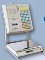
ELZAB Eta-Prima na stojaku pionowym