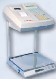
ELZAB Eta-Prima na stojaku poziomym